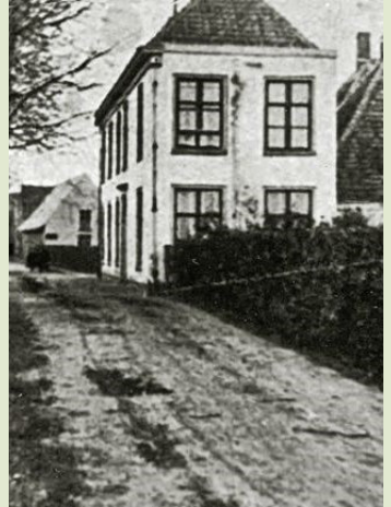
Huize Bijweg, ca 1830–1902